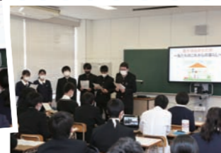
Newセサミプラン 課題研究発表会