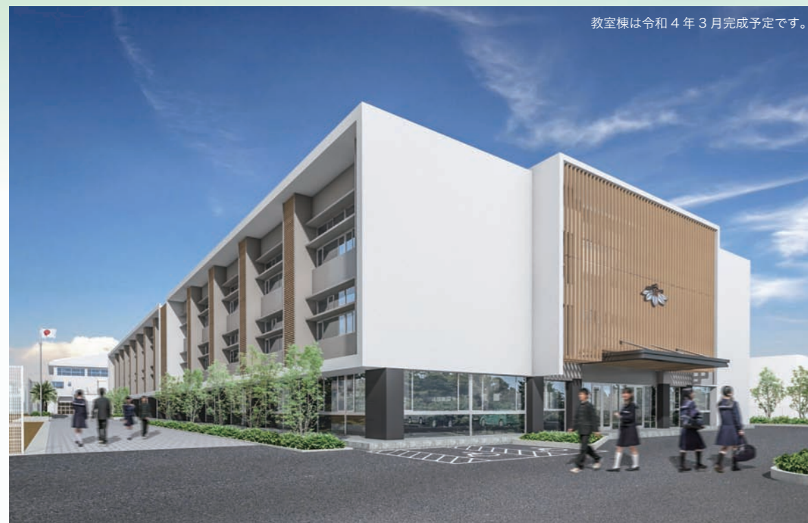
教室棟は令和4年3月完成予定です。

心地よい風が吹き抜け、爽やかな光が降り注ぐ、癒しのある校舎で共に学びましょう！！