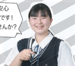
四ヶ所 青空【大刀洗中】