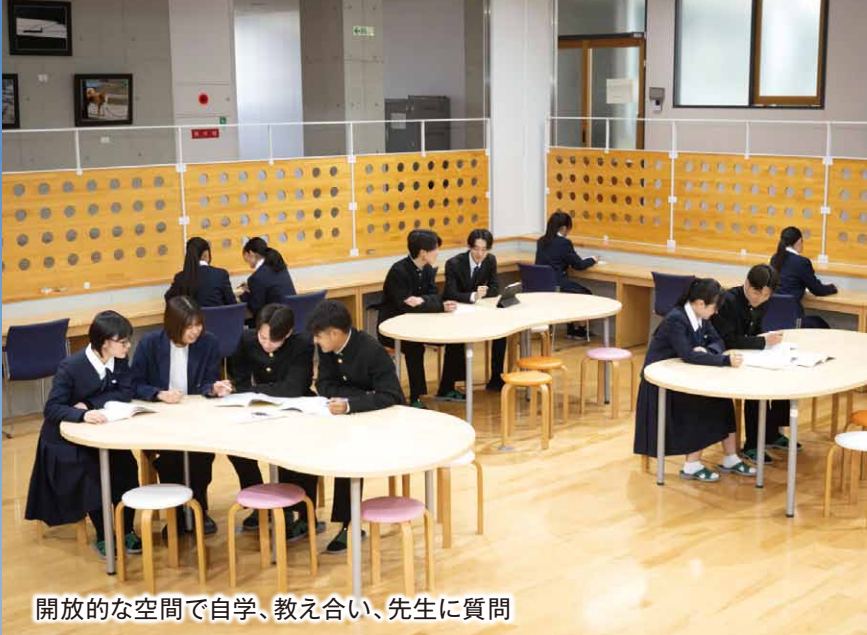
開放的な空間で自学、教え合い、先生に質問