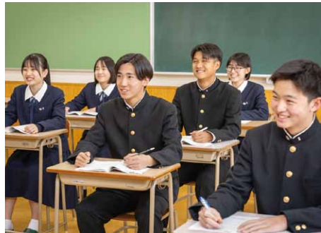
わかりやすい授業