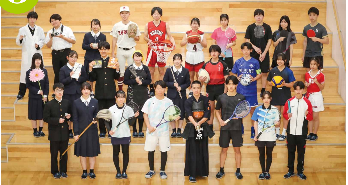
上段／自然科学部、写真部、茶道部、野球部、バスケットボール部(男女)、バドミントン部(男女)、卓球部(男女) 中段／華道部、美術部、ESS部、ホームメイキング部、吹奏楽部、ラグビー部、サッカー部、バレーボール部(女)、バトン部 下段／放送部、書道部、ソフトテニス部(男女)、剣道部、テニス部(男女)、陸上部(男女)

文武両道を目指し、活動しています。全国大会出場をはじめ各部活動が九州大会、県大会出場と多くの実績を残しています。