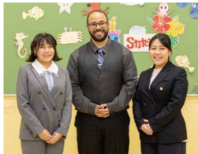
楽しく、基礎的にも、専門的にも学べる