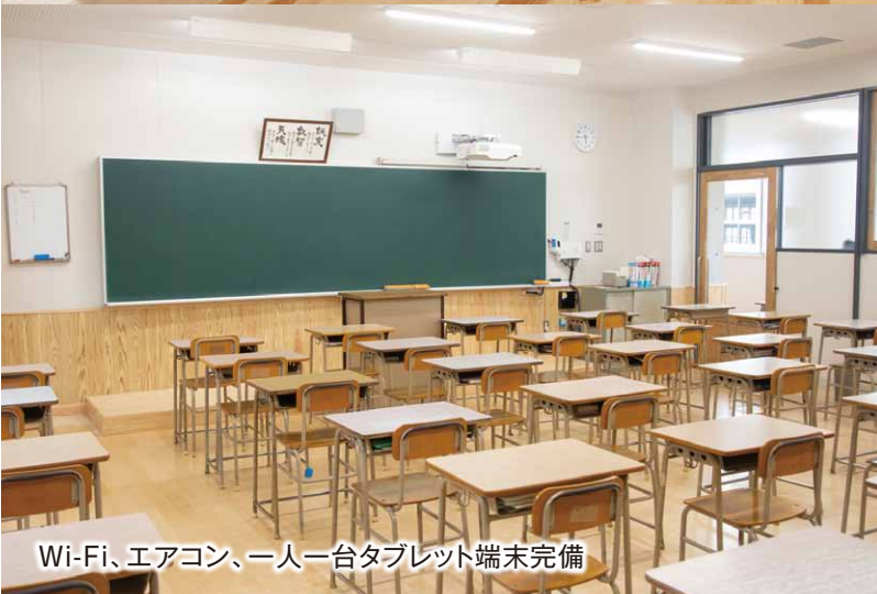
Wi-Fi、エアコン、一人一台タブレット端末完備