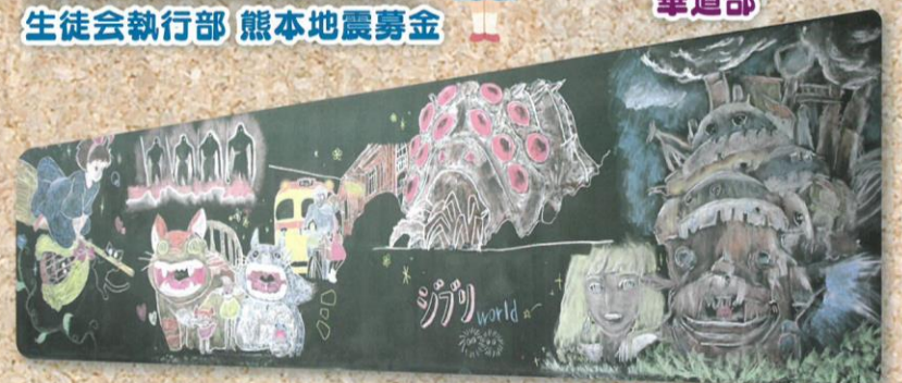
美術部 黒板アート