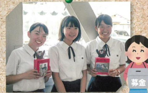
生徒会執行部 熊本地震募金