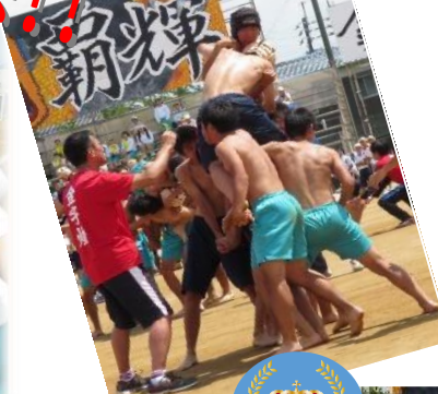
仲間と作り上げた 体育祭は 最高の思い出!