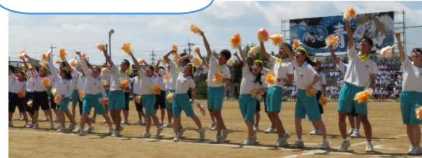
短い練習期間で、 高い完成度に 仕上がっていきます!