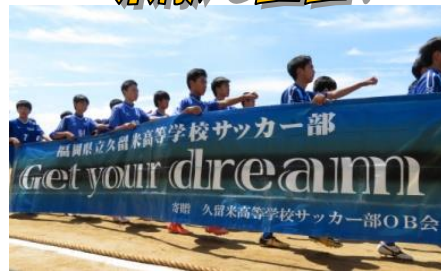
↓入場行進の練習。一糸乱れぬ膝の上げっぷり。