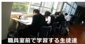
職員室前で学習する生徒達

それぞれの目標に向かって日々努力する生徒たち。「頑張っているのは自分だけじゃない」そう思える環境が久留米高校の進学実績を支えています。指導する先生たちのサポートもあり、進路が決定する最後の最後まで、生徒は自分の目標に向かって突き進むことができるのです。