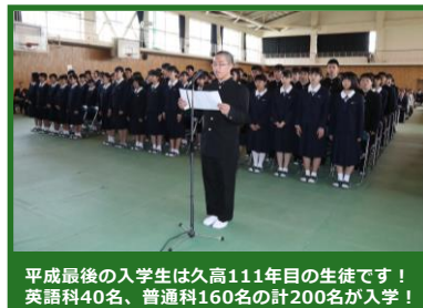
平成最後の入学生は久高111年目の生徒です！ 英語科40名、普通科160名の計200名が入学！

この「久高だより」は福岡県立久留米高等学校の魅力をお伝えするための広報誌です。第1号は一番気になる「進学実績」そして「久留米高校の特色」についてご紹介していきます！