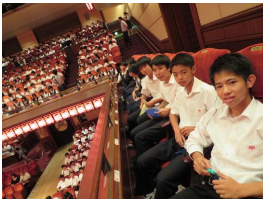
「イヤホンガイドがあって分かりやすかったです」

本校創立110周年記念行事の1つとして、6月18日(月)に博多座で歌舞伎を鑑賞しました。演目は「伊達の十役」松本幸四郎でした。