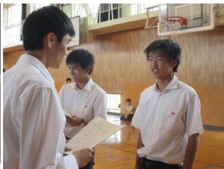
受付での挨拶の練習をしています