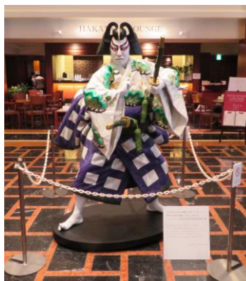
実物大の人形がお出迎え